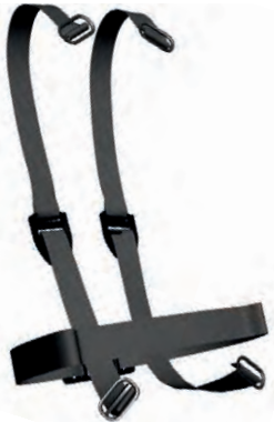
Schultergurt , eine Seite, komplett (10089280) Hüftgurt , komplett (10089291)

Die flammbeständige Bänderung aus Polyamid verteilt das Gewicht des Pressluftatmers auf Schultern und Hüften.