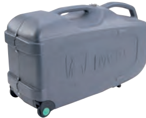
Transportkoffer für alle PA mit einer oder zwei Flaschen (10049021)