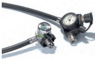
Druckminderer SL , ohne Leitungen (10068765) Druckminderer SL-Q mit QuickFill Kupplung, ohne Leitungen (10068766)