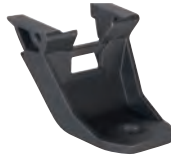
Ventilschutz AirGo für 1 Flasche (10145942)