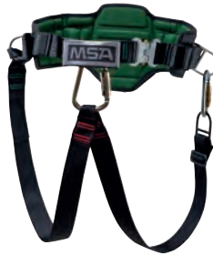
alphaBELT Pro Rettungs- & Haltgurt (10151246) alphaBELT Basic Haltegurt ohne Verbindungsmittel (10151241) alphaBELT Lanyard Verbindungsmittel (10151242) Tri-Lock Karabiner, Stahl (10157585)