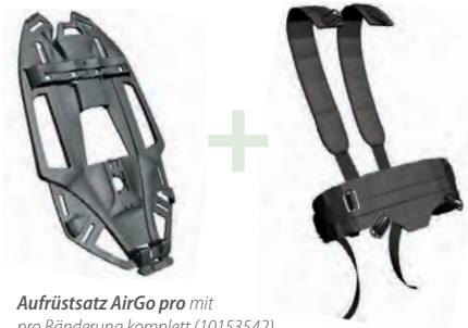
Aufrüstsatz AirGo pro mit pro Bänderung komplett (10153542) pro Bänderung ohne Hüftgurt (10164913)

Um den revolutionären alphaBELT Halte- und Rettungsgurt von Beginn an zu integrieren, sind beide Aufrüstsätze auch ohne den standard Hüftgurt erhältlich.