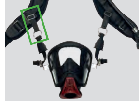
Helm-Masken-Halter für PA, Set (10164914)

Mit diesen kleinen Haltern können Sie Ihre Helm-Maske praktisch vor der Brust an Ihren Schultergurten tragen, indem Sie die Helmadapter einfach in die D-Ringe einhaken.