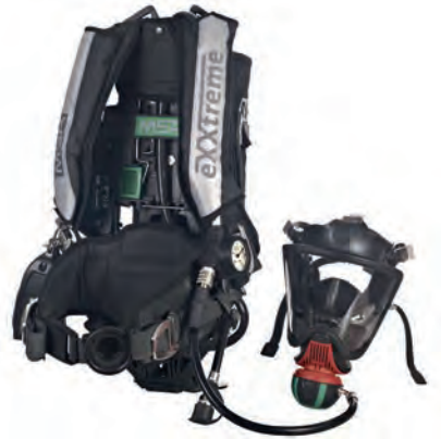
eXXtreme Aufrüstsatz , schwarz (10145843) (inkl. Flaschenbandspanner aus Edelstahl)