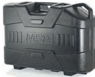
Transportkoffer für PA, standard (10126797)