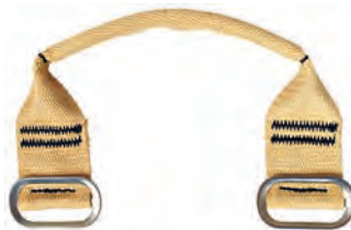
Rettungsgriff für Pressluftatmer, 4er-Pack (10152624)