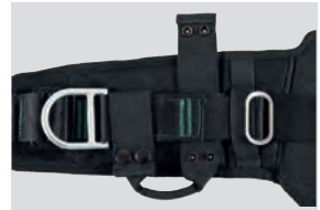
Kleine Trageschlaufe für PA-Gurte (10151249)

Nicht nur zusätzliche Ausrüstungsgegenstände müssen zugelassen sein, sondern auch die Verbindungslösung muss kompatibel sein mit der Bänderung. Diese kleine Trageschlaufe ist zugelassen für die Nutzung mit einem MSA Pressluftatmer.