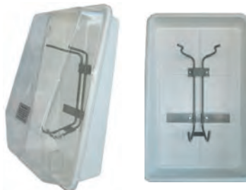
Pressluftatmer-Wandbox Typ A (D4080801)