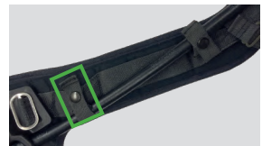
Schlauchhalter, Druckknopf (D4075832)

Unser Schlauchhalter mit Druckknopf hält Ihre Leitungen für Luftversorgung und Manometer sicher und nah am Schultergurt Ihres Pressluftatmers.