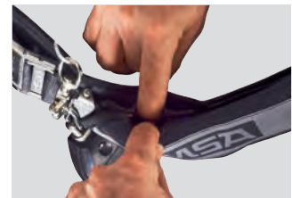
MaXX Schutztunnel Set, schwarz (10158776)