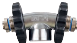
T-Stück 115/200 bar , für 4l Stahlflaschen (D4085817) T-Stück 136/300 bar (10056606) T-Stück 156/300 bar , für 6/6.8l Composite-Flaschen (D4075818) T-Stück 166/300 bar , gerade (10032711)

Besondere Einsätze erfordern einen größeren Luftvorrat. Mit dem T-Stück können Sie die Nutzungsdauer Ihres Pressluftatmers verlängern, indem Sie zwei Flaschen gleichzeitig nutzen. Es ist leicht am Druckminderer an der Rückenplatte zu montieren und wird mit zwei Schraubädern geliefert.