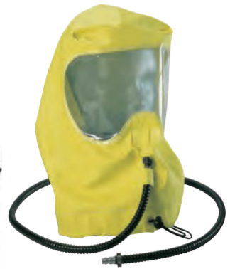
RespiHood, komplett (10045764)