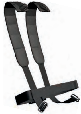
Schultergurt , komplett (10089292) Hüftgurt , komplett (10089291)

Diese Bänderung besteht aus den gepolsterten Schultergurten der pro Bänderung und den einfachen Hüftgurten der compact Bänderung.