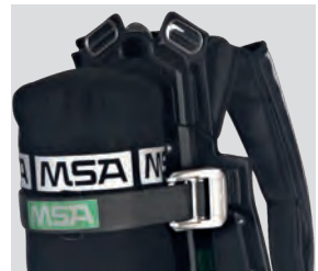
eXXtreme Flaschenspannband, komplett (10040411)

Um die wichtige Verbindung zwischen Flasche und Pressluftatmer-Trageplatte angemessen zu schützen und Langlebigkeit zu gewährleisten, besteht unser Flaschenspannband aus robustem Kevlar und einer patentierten Metallschnallenlösung.