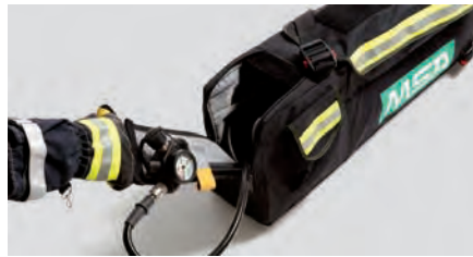
Sicherheitsstrupptasche SL (10103749) Sicherheitsstrupptasche SL lang (10104597) Sicherheitsstrupptasche SL-Q (10104598)