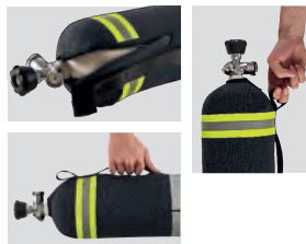
Flaschen-Schutzhülle eXXtreme, 6-6,9 l, schwarz (10155096)