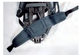
Hüftgurtplatte Aufrüstsatz , für AirGo Pressluftatmer (10089276)