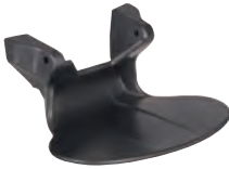
Ventilschutz AirMaXX für 1 oder 2 Flaschen (10087372-SP)

Unser Stoßschutz für Flaschenventile ist konstruiert worden, um grobe und direkte Stöße abzufangen. Im Ernstfall jedoch gibt er nach, damit der Nutzer nicht in die Gefahr kommt, hängen zu bleiben.