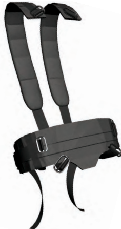
Schultergurt , komplett (10089292) Hüftgurt , komplett (10089293)

Großzügig gepolsterte Schulter- und Hüftgurte verteilen das Gewicht des Pressluftatmers körpergerecht und sind deshalb sehr komfortabel. Besonders sichere Gurtschlösser ermöglichen ein schnelles An- und Ablegen des Gerätes. Der Hüftgurt wird einfach durch Ziehen der Gurtenden nach vorn eingestellt. Die stark belastbare Bänderung besteht aus Nomex Mischgewebe.