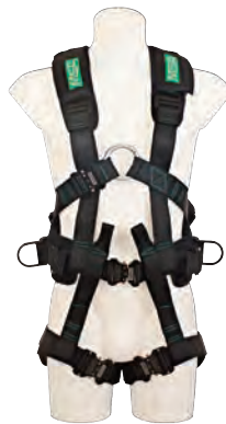
alphaFP pro, standard (10116541) alphaFP pro, groß (10117573)