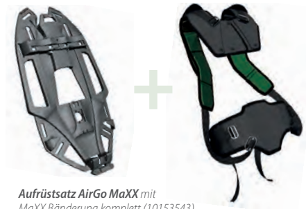
Aufrüstsatz AirGo MaXX mit MaXX Bänderung komplett (10153543) MaXX Bänderung ohne Hüftgurt (10164912)