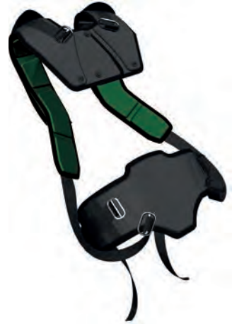
Schultergurt links, komplett (10027673) Schultergurt rechts, komplett (10027674) Hüftgurt, komplett (10027670)