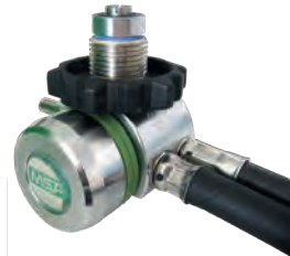
Druckminderer Classic , ohne Leitungen (10068762)

Das Pneumatik-System Classic verwendet einzelne Leitungen für jede Funktion. Standard sind eine Mitteldruckleitung zum Lungenautomaten und eine Hochdruckleitung zum Manometer.